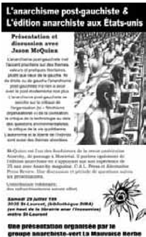
Fig. 3.17 Affiche, discussion avec Jason McQuinn