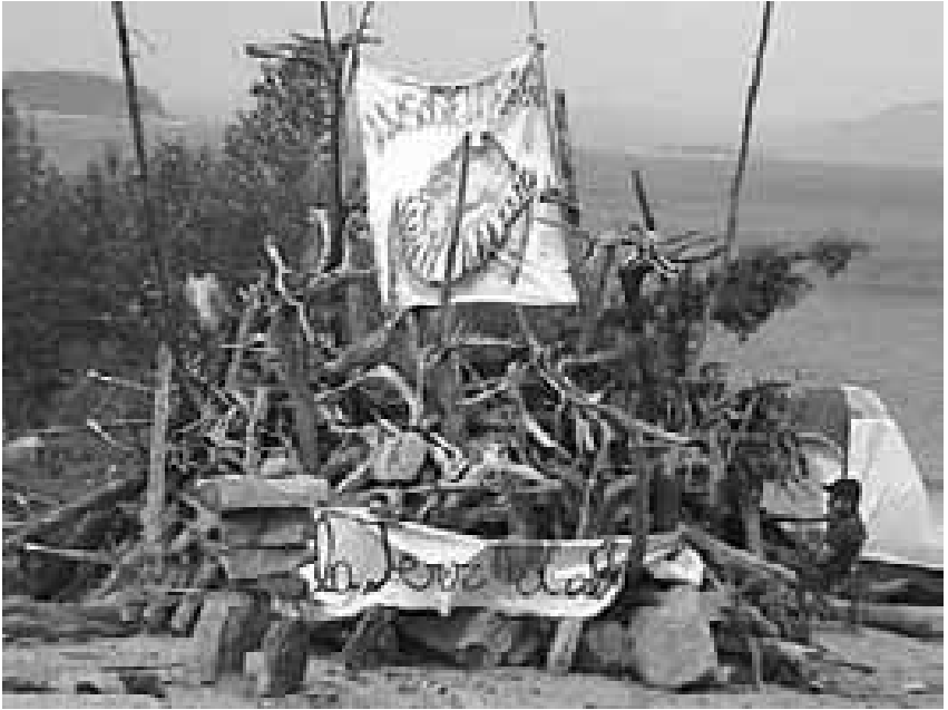
Fig. 3.22 Première expédition à l'été 2004 sur l'Île René-Levasseur.

Le groupe a organisé le premier Festival Écoradical avec Libterre en 2004. Il initie une série de Veillées Boréales au Café Chaos : des soirées mensuelles où sont projetés divers films (dont plusieurs référents à Earthfirst!) sur des enjeux environnementaux, centrés sur la sauvegarde des forêts. Les soirées sont suivies de discussions au sujet de l'écologie et de diverses expériences de pratiques écologistes, avec une emphase sur la radicalité du discours et des pratiques.