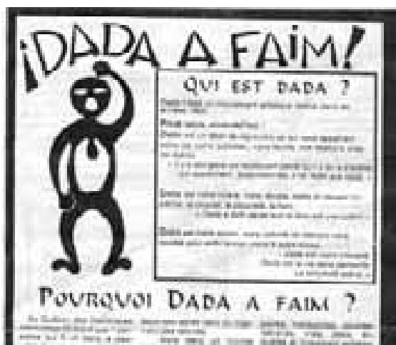
Fig. 3.23 Extrait d'un document de Dada a faim

Dada a faim s'est formé au printemps 2002 à la suite de l'expérience de comités de récupération et cuisine de nourriture qui avaient été organisés dans le cadre des