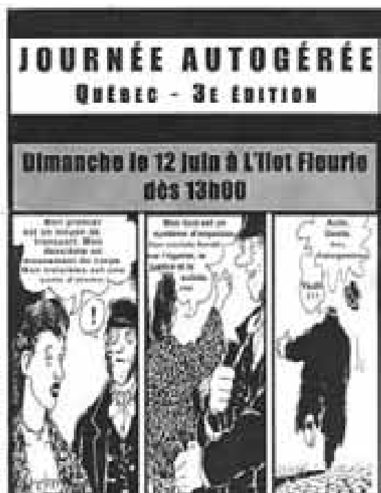
Fig. 3.24 Affiche pour la Journée Autogérée de Québec, 2005.