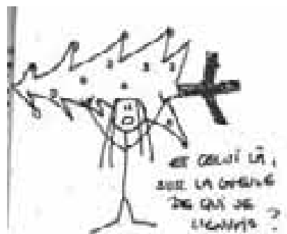
Fig. 3.15 Sketch humoristique, Terre et Liberté no. 1 vol. 1