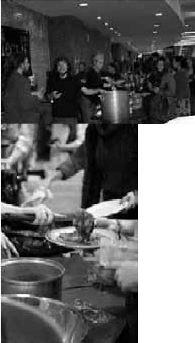
Fig. 3.19 Distribution de nourriture à l'Université Laval par le Collectif de Minuit