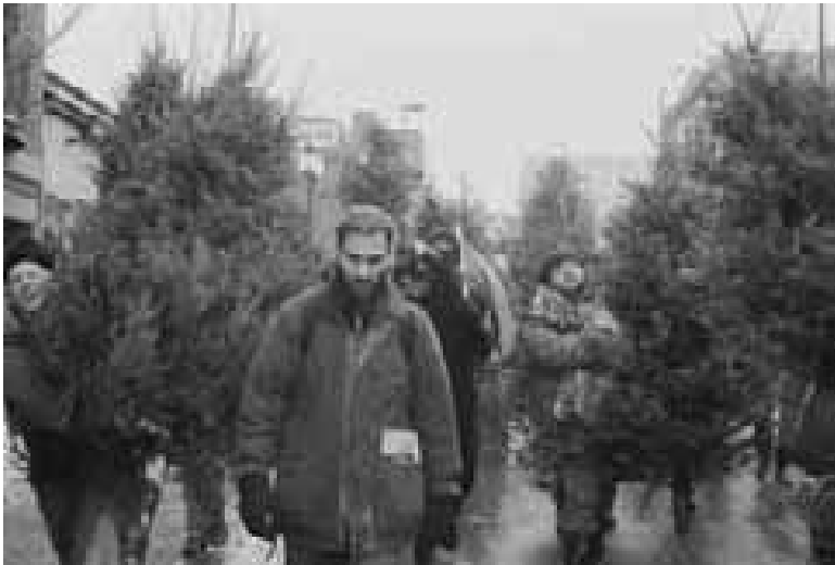
Fig. 3.21 Manifestation pour la sauvegarde de la forêt boréale, le 28 juillet 2004

À ses débuts, la Terre d'Abord est exclusivement centré sur la protection de la forêt Boréale, principalement par le biais de la campagne pour la sauvegarde de l'Île René Levasseur, qui a été initiée collectivement par le mouvement écologiste radical du Québec (avec PPL et Liberterre). Le groupe organise quelques manifestations, dont deux avec des sapins de Noël au rebus pour symboliser la déforestation.