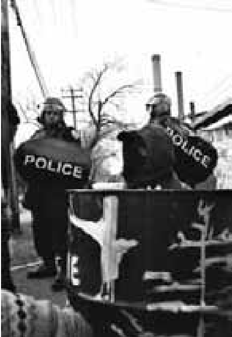
Fig. 3.20 Désobéissance civile devant Kruger