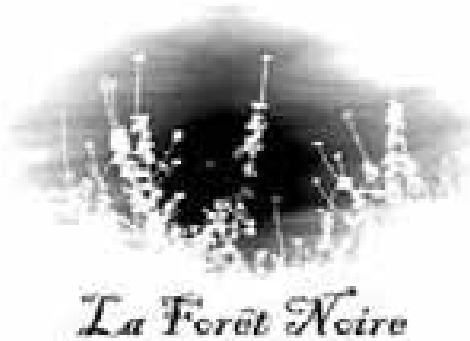
Fig. 3.26 Logo de la Forêt Noire