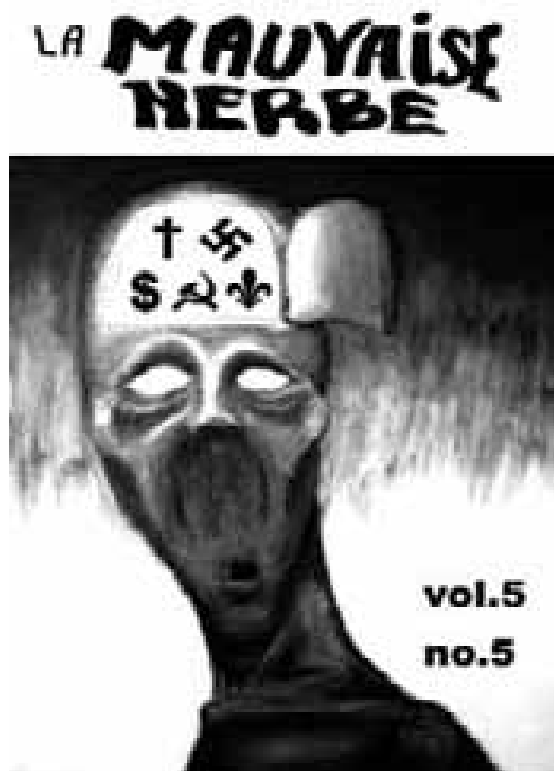
Fig. 3.16 Mauvaise Herbe, couverture du numéro d'automne 2006

[...] un collectif qui diffuse le journal anarcho-écologiste du même nom. Le collectif fait aussi la diffusion de livres neufs et usagés, mais aussi de brochures concernant l'anarchie, l'écologie radicale, la dé-domestication, les luttes autochtones, la libération animale, etc., ainsi que des critiques du capitalisme, de la civilisation, de la technologie/industrie et du fétichisme organisationnel. Il rassemble des anarchistes de diverses tendances promouvant ainsi la diversité que peut (et doit!) prendre l'anarchisme (CRAC-K, 2007).